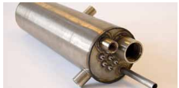
Exempel på produktutförande