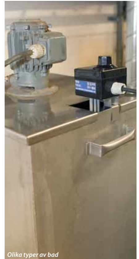
Olika typer av bad