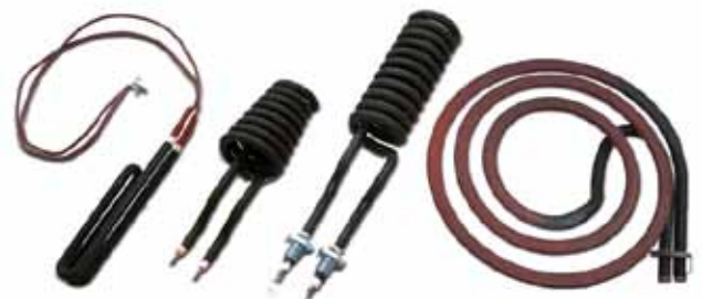
Exempel på produktutförande