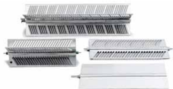
Exempel på produktutförande